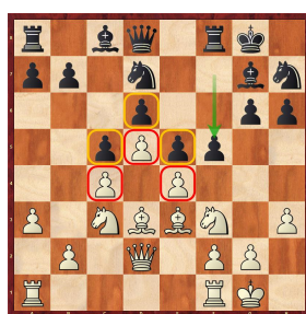
Trippold - Millet 2019