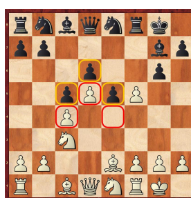
Keymer - Carlsen 2019